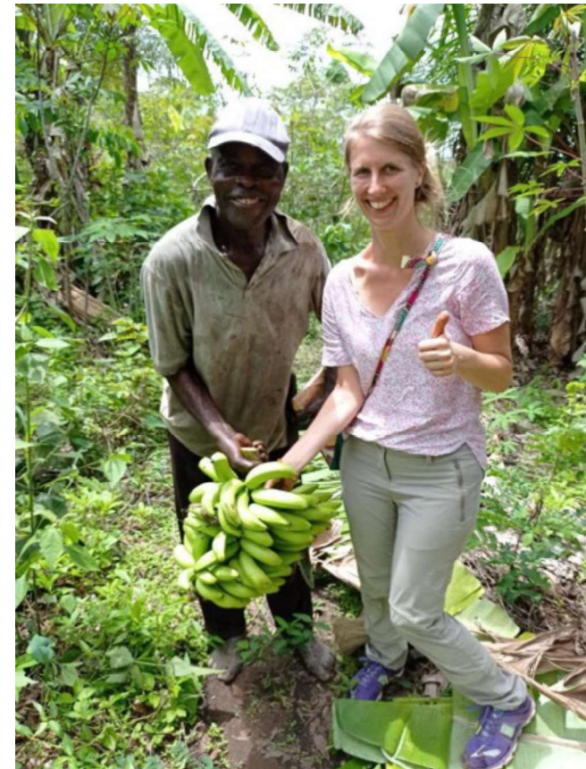
Besuch auf der Selbstversorgerfarm